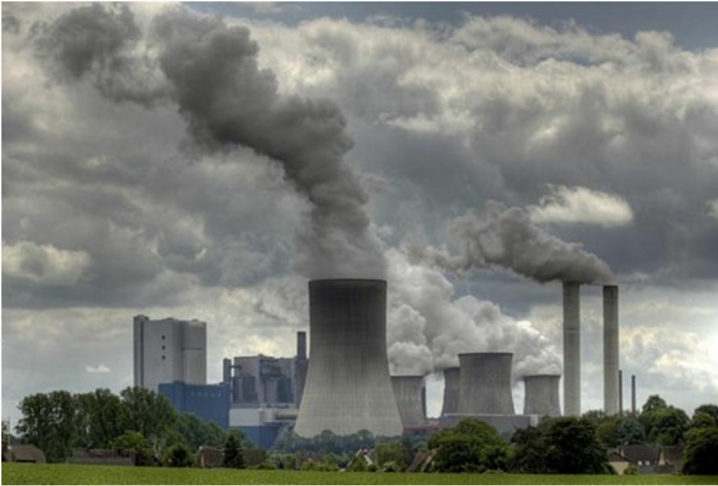
Loji kuasa gas dan arang batu juga sangat mencemarkan Bumi tercinta kita ni.

Namun ada juga yang menerangkan bagaimana sesetengah negara menamatkan loji kuasa arang batu dan diganti dengan loji kuasa gas , sebab itulah kami kata “mungkin dah lapuk”, sebab ada antara mereka yang dah berusia lebih sepuluh tahun.